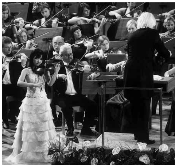
Srebrna medalistka Airi Suzuki — na koncercie galowym z Orkiestrą Filharmonii Poznańskiej pod dykcją Tadeusza Wojciechowskiego

Przebieg koncertu można było obserwować także przed aulą UAM — na specjalnym ekranie