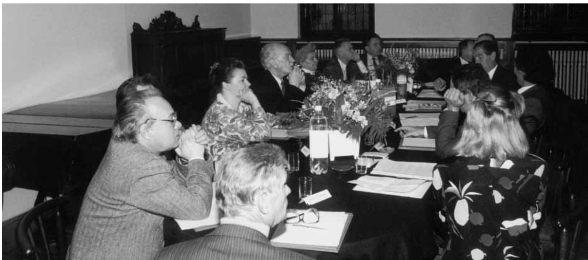
Jury podczas obrad w sali Muzeum Instrumentów Muzycznych