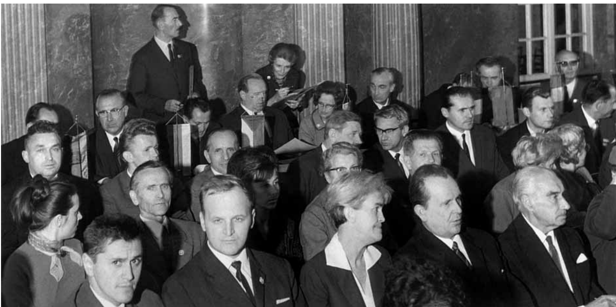
Jurorzy i słuchacze konkursowego „recitalu” w Sali Czerwonej Pałacu Działyńskich