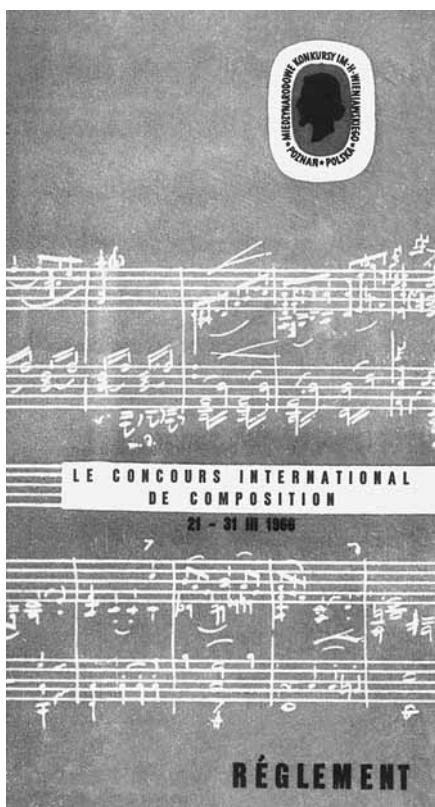
Okładka regulaminu III edycji Konkursu

Przedmiotem III edycji Konkursu był jednocześnie utwór na skrzypce z towarzyszeniem zespołu kameralnego (4-8 osób), lub orkiestry kameralnej, trwający od 8 do 12 minut. W zespole akompaniującym powinny być znaleźić się: flet, obój, klarnet, fagot, róg, trąbka, puzon, fortepian, wiolonczela, kontrabas i perkusja. Na siedzibę Konkursu wybrano Państwową Wyższą Szkołę Muzyczną w Poznaniu.